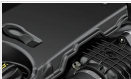
BlueHDi 120 Manuale 6 Rapporti Stop&Start